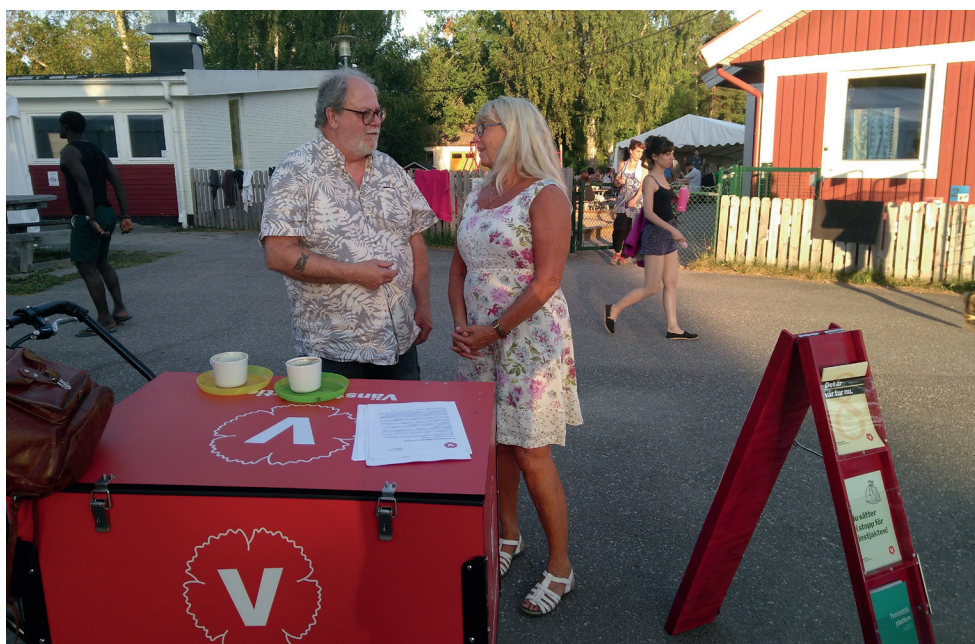
Herräng Dance Camp är en del av ett rikt kulturliv!

Kulturen speglar det samhälle vi lever i. I Norrtälje kommun finns många ideella och kreativa krafter, som vi bör stödja och uppmuntra. Biblioteken utgör själva grunden för kulturlivet och utveckling av bibliotek och skolbibliotek är en ytterst viktig rättvisefråga. Roslagsmuséet har en betydelsefull roll som "länsmuseum" för norra delen av Stockholms län.